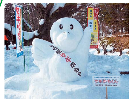
弘前警察署と弘前地区防犯協会が作成した「サギかもくん」の雪像 (令和5年2月弘前城雪灯籠まつり)