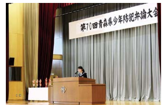
西部大会（五所川原第一中学校）