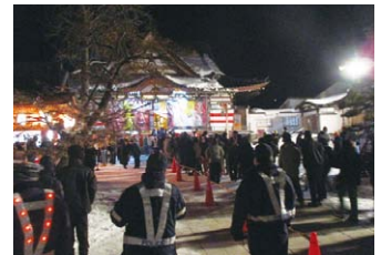
最勝院（弘前市）での警備状況

また、小さいお子さんが押されて転んだりしないように、保護者の方は十分に注意しましょう。