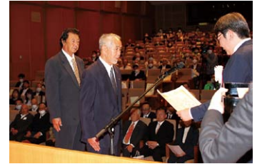
防犯栄誉金章の伝達

10月11日青森市のリンクモア平安閣市民ホールにおいて、「令和5年度安全・安心まちづくり青森県民大会」(県、県教委、県警本部、県防連主催)を開催しました。大会の冒頭で、防犯功労者、防犯功労団体及び功労ボランティア団体として、次の方々が表彰されました。心からお祝い申し上げます。